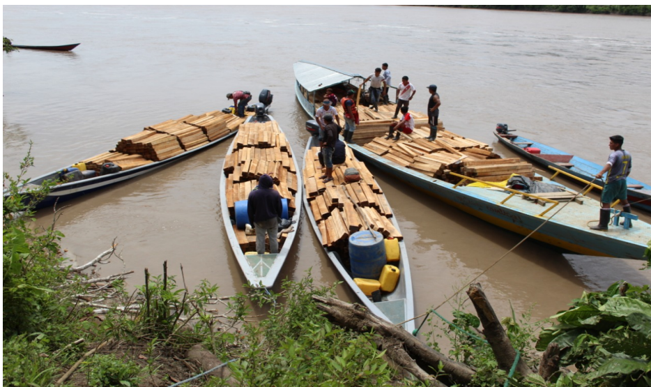
Foto del 24 de noviembre. Embarcaciones con madera extraída de manera ilegal retenidas Comunidad Soledad, territorio del GTANW.

Desde las 16h00 aproximadamente 4 líderes indígenas Wampis y un grupo de 14 jóvenes fueron secuestrados por intermediarios ecuatorianos vinculados a la tala y comercialización ilegal de madera en la provincia de Morona Santiago, siendo las 21h30 las 18 personas fueron liberadas.